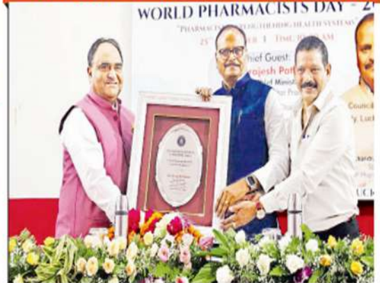
फार्मसी काउंसिल व डिप्लोमा फार्मासिस्ट असोसिएशन के कार्यक्रम में उठी फार्मसी रेगुलेशन ऐक्ट लागू करने की मांग।